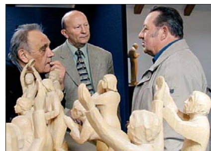
Ausstellung „Die Hütte“ Pobershau Výstava „Die Hütte“ v Pobershau

■ Aufgrund des Bedarfes an kommunalen Projekten in der tschechischen Grenzregion ist ein Projekt in Phare CBC entstanden, dass die Bürgermeister dieser Region mit der Deutschen Förderpraxis vertraut machen soll. So reisten im März und im April jeweils 20 Bürgermeister zu Kollegen nach Sachsen, die über das Programm Interreg