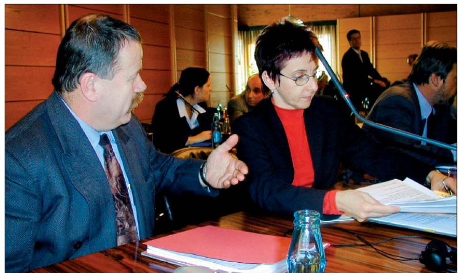
Příprava přechodu programu Phare CBC v Chamu na Interreg. Vorbereitung der Überbrückung des Programms Phare CBC zu Interreg in Cham.

V ČESKO - SASKÉM PŘÍHRANIČÍ BYLO SCHVÁLENO 16 PŘESHHRANIČNÍCH PROJEKTŮ 16 GRENZÜBERSCHREITENDE PROJEKTE IM SÄCHSICH-BÖHMISCHEN GRENZRAUM WURDEN BEWILLIGT