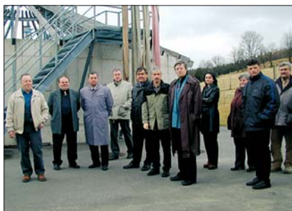
Kläranlage Jöhstadt Čistírna odpadních vod v Jöhstadtu

■ Na základě potřeby úspěšného podávání projektů pro obce v českém příhraničí vznikl projekt Phare CBC, podle kterého se mohli starostové z české části našeho euroregionu podrobně obeznámit s tím, jak v praxi získávají dotace na německé straně. V březnu a dubnu tak na základě tohoto projektu mohly vycestovat dvě skupiny po 20 starostech ke svým saským kolegům, kteří již projekty v programu Interreg realizovali. Byli to starostové z Pobershau a Jöhstadtu, kteří předali své zkušenosti českým starostům. Brzy budou i oni po vstupu České republiky do EU moci také využívat program Interreg IIIA.