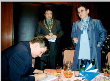
„Taufe“ des Buches / křest knihy (str./Seite 11)