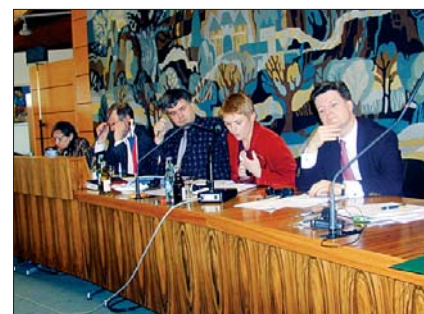
Jednání v Chamu Tagung in Cham

úplně rozhodnuto, jak bude realizována implementace, ale role euroregionů zůstane nadále významná. Grantové schéma pojmá česká strana jako překlenutí doby do přijetí programu Interreg III A, který je pro současné aktivity našeho euroregionu nejvyšší prioritou. V rámci Asociace euroregionů České republiky, kde hraje náš euroregion významnou roli, usiluje o prosazení stejných procedur, jako má německý partner.