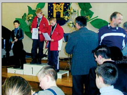
Siegerehrung in Geyer bei Annaberg. Vyhlášení vítězů v Geyeru u Annabergu.