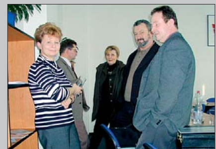
Deutscher Teil der Arbeitsgruppe Německá část komise