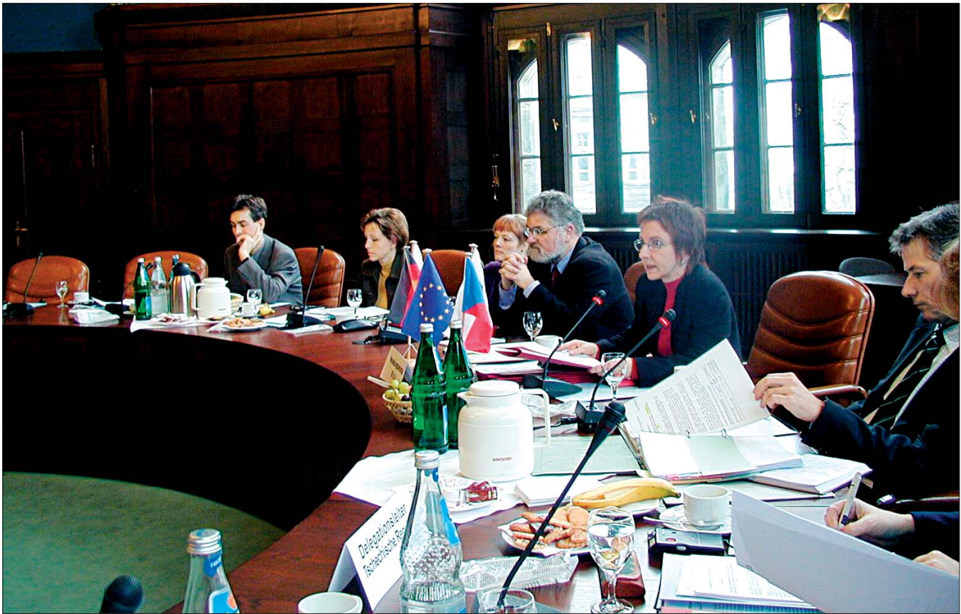
Tagung des Lenkunkausschusses Interreg in Dersden. Jednání Řídicího výboru Interreg v Drážďanech.